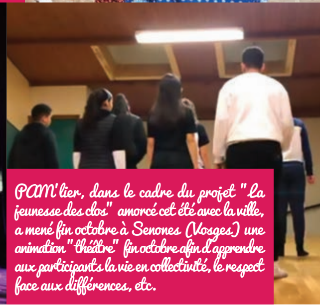
PCM'lier, dans le cadre du projet "la jeunesse des clos" amorcé cet été avec la ville, a mené fin octobre à Senones (Vosges) une animation "théâtre" fin octobre afin d'apprendre aux participants la vie en collectivité, le respect face aux différences, etc.