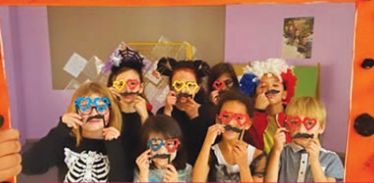
De petits monstres ont semé la terreur au centre de loisirs à l'occasion d'Halloween