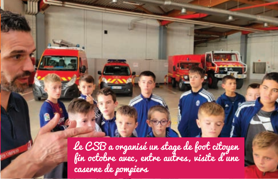
Le CSB a organisé un stage de foot citoyen fin octobre avec, entre autres, visite d'une caserne de pompiers