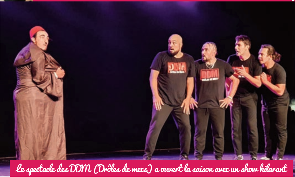
Le spectacle des DDM (Drôles de mecs) a ouvert la saison avec un show hilarant