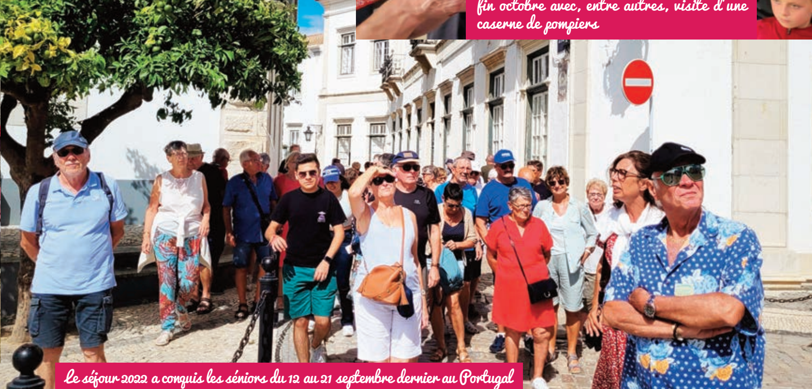
Le séjour 2022 a conquis les séniors du 12 au 21 septembre dernier au Portugal