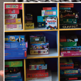
P.12 La ludothèque prête ses jeux