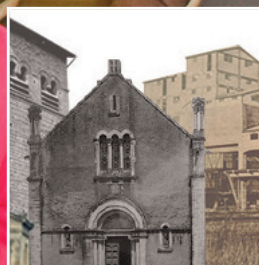
P.8 Dessignons ensemble le Blénod de demain