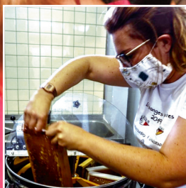
P.5 Le rucher pédagogique

Au cœur de toutes les actions : l'enfance jeunesse